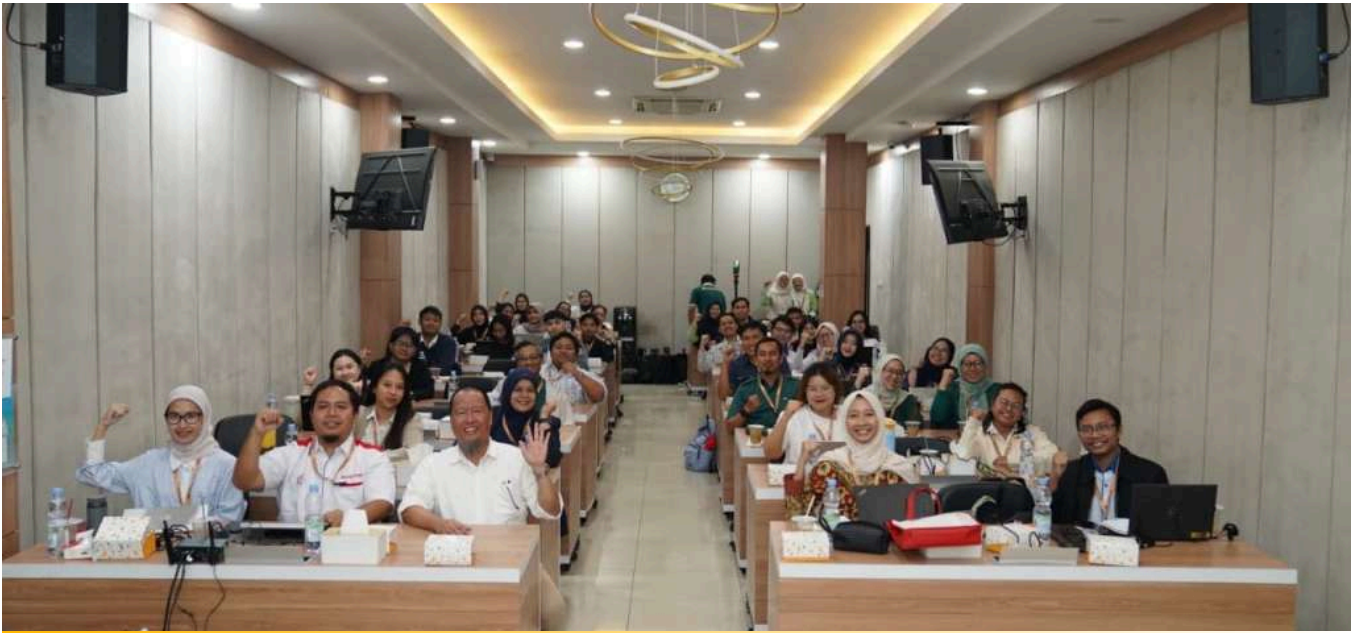
Hoạt động hợp tác của Dexe Group với các cơ quan chứng nhận nhằm nâng cao năng lực đáp ứng quy định Halal bắt buộc tại Indonesia (2026).

Ở cấp độ thực thi, BPJPH cũng đẩy mạnh giám sát và hướng dẫn doanh nghiệp, đặc biệt trong lĩnh vực bán lẻ hiện đại, nhằm đảm bảo sự sẵn sàng cho thời điểm chính sách có hiệu lực. Chính phủ nhấn mạnh rằng chứng nhận Halal không chỉ là yêu cầu pháp lý mà còn là công cụ chiến lược giúp nâng cao niềm tin người tiêu dùng, mở rộng thị trường và tăng cường năng lực cạnh tranh của doanh nghiệp Indonesia trong nước và quốc tế.